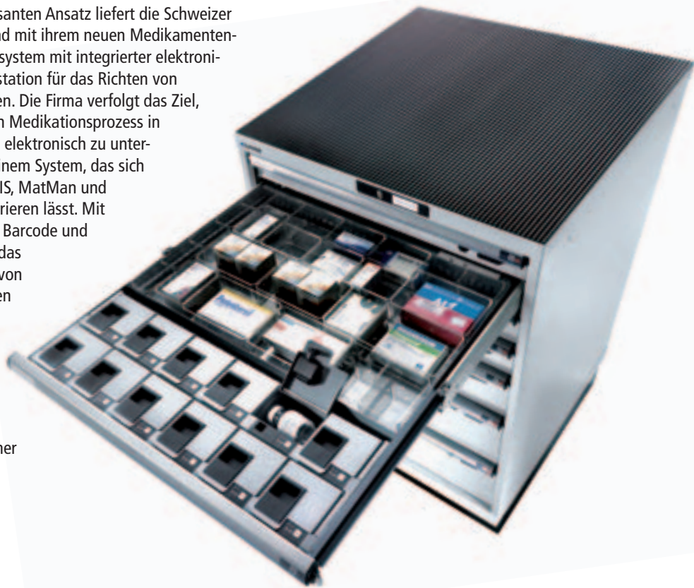
Elektronische Medikamentenschublade von LISTA