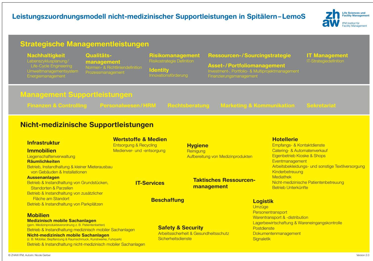
Abbildung 3: Leistungszuordnungsmodell für nicht-medizinische Supportleistungen in Spitälern

Autorinnen: Nicole Gerber und Viola Läubli, Zürcher Hochschule für Angewandte Wissenschaften (ZHAW), Institut für Facility Management (IFM)