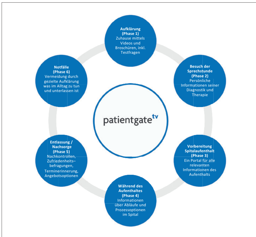
In jeder Phase des Spitalaufenthalts erleichtert und professionalisiert patientgate.tv die Kommunikation.

gung ist von zentraler Bedeutung, um sichere Abläufe zu gewährleisten. Korrekte Informationen einfach und persönlich auf einen Blick und jederzeit und auf jedem Endgerät in gleicher Weise abrufbereit zu haben, sind unabdingbar. Moderne Kommunikationstechnologien wie patientgate.tv erlauben letztlich auch den direkten Kontakt zum Behandlungsteam per Email oder Chat, ohne dass Ärzte und Pflegende ständig mit Nachrichten überfallen werden.